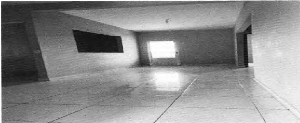
FOTO3: Sala 1.

CNPJ 13.922.554/0001-98 – Telefax: (75) 33392150 / 2128