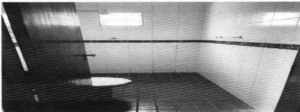
FOTO 5: Banheiro (foi possível notar estufamento das placas cerâmicas localizada na parede do chuveiro).

Daniel Moreira Damasceno Daniel Moreira Damasceno Engenheiro Civil CREA-BA 3000090593