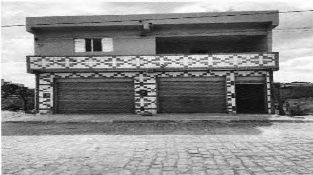
FOTO 1: Fachada principal da Delegacia de Polícia Militar (nível superior).

AVENIDA PEDRO GASPAR, N°72, BAIRRO, CENTRO, SOUTO SOARES-BA. (DELEGACIA DE POLÍCIA MILITAR).